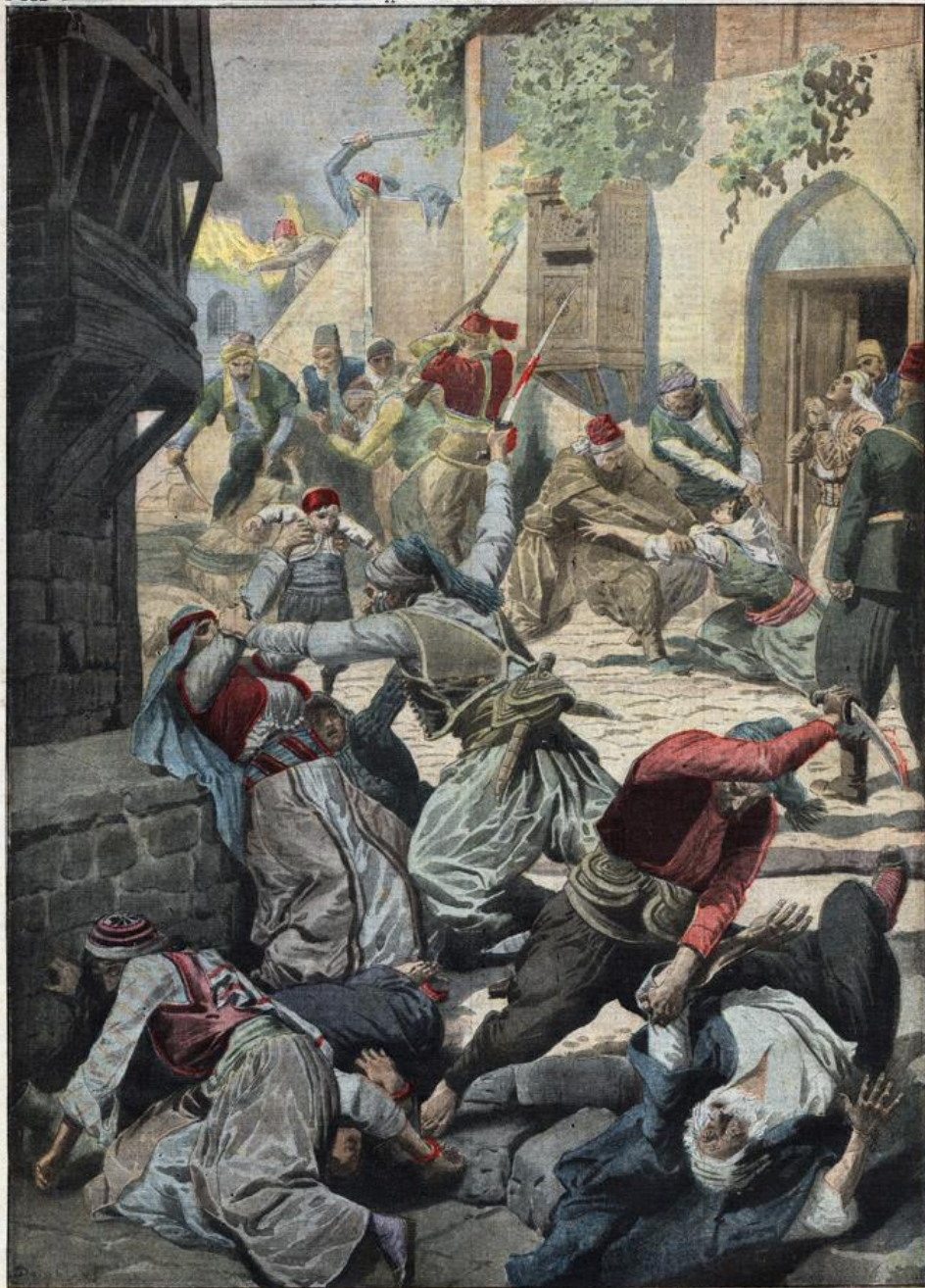
LES MASSACRES D'ARMÉNIE