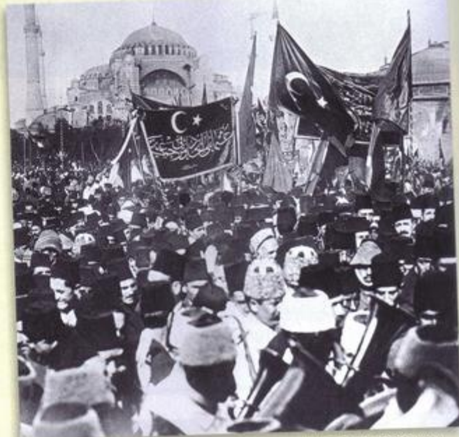
Une manifestation à Istanbul pour l'entrée en guerre de la Turquie, octobre 1914.