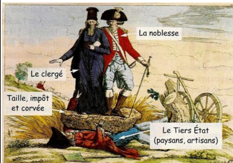
Document 1 : Gravure de 1789.

Avant la Révolution de 1789, la société française était organisée en trois ordres (le clergé, la noblesse et le tiers état) qui n'avaient ni les mêmes droits, ni les mêmes devoirs.