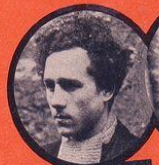
WITSCHITZ JUIF POLONAIS 15 ATTENTATS