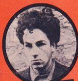
WASJBROT JUIF POLONAIS 1 ATTENTAT - 3 DÉRAILLEMENTS