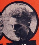
ELEK JUIF HONGROIS 8 DÉRAILLEMENTS