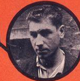
FONTANOT COMMUNISTE ITALIEN 12 ATTENTATS