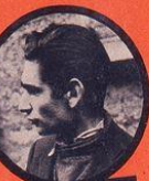
FINGERWEIG JUIF POLONAIS 2 ATTENTATS - 6 DÉRAILLEMENTS