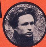
RAYMAN JUIF POLONAIS 13 ATTENTATS