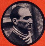
BOCZOV JUIF HONGROIS CHEF DÉRAILLEUR 20 ATTENTATS