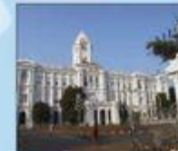
Le fort Saint-George qui abrite le Musée militaire.

Appelée aussi Chennai. Elle possède un grand port et la deuxième plus longue plage du monde, Marina Beach (12 km).